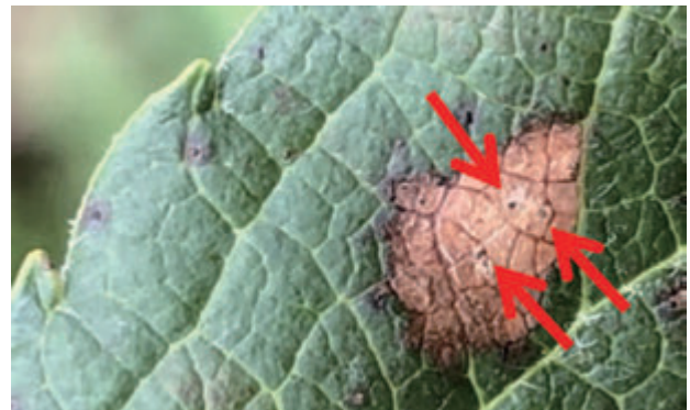
図3 褐斑病の病斑を拡大 (矢印が病斑内部の分生子層)

次伝染を繰り返す。盛夏期～秋季にかけて新梢葉で多発すると、被害葉が早期落葉し、果実感染も起こる。