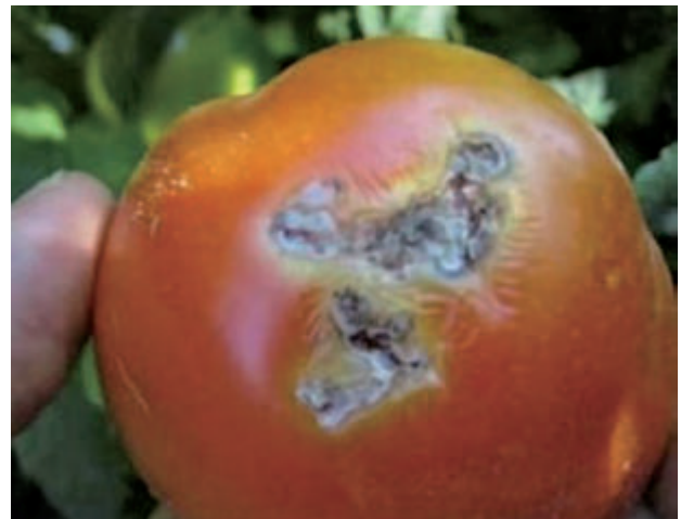
図1 トマトキバガ幼虫による食害痕