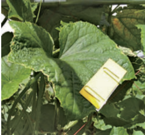
写真1 感水紙設置の様子

手散布では丁寧に散布していても葉裏への付着状況にムラがあり、散布者が思ったようには農薬が付着していない状況を確認した。また作業時間は10aあたり2時間以上であり、散布作業に負担を感じていた。一方、自走式防除機（写真2）では、全体的に農薬の付着が良好で、散布ムラが少ない状況であった。散布時間も10aあたり1時間程度と短く、散