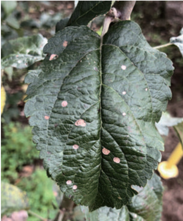
図4 斑点落葉病の病斑

防除ポイントの1つ目は落葉処理である。前述のとおり褐斑病の一次伝染源は前年の被害落葉上であることから、落葉処理を行うことによってほ場内の菌密度を低下させることができる。越冬伝染源となる子のう胞子は12月上旬までに落葉した被害葉から多く飛散する。このことから、完全落葉を待つことなく、12月上旬に落葉処理をすることで翌年の発生軽減効果が期待できる。