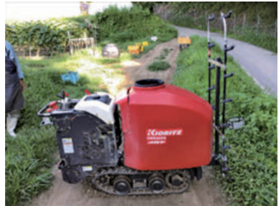
写真2 自走式防除機