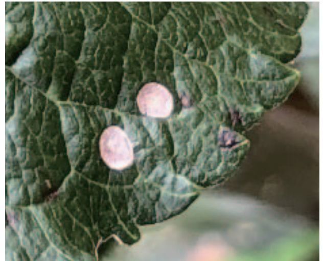
図5 斑点落葉病の病斑を拡大 (病斑内部には何も見えない)

ポイントの2つ目は薬剤散布である。一次伝染期となる5月下旬～6月上旬には防除間隔を空けることなく、防除を行う。二次伝染期となる7月上旬～中旬には、ベンゾイミダゾール系薬剤（ベンレート水和剤、トップジンM水和剤）を散布する。なお、ベンゾイミダゾール系薬剤耐性菌が県内でも散見されていることから、ベンゾイミダゾール系薬剤の効果が低い園地ではユニックス顆粒水和剤、オンリーワンフロアブルを散布する。二次伝染期の防除にあたっては、多発してからの薬剤散布は効果が低下するだけでなく、薬剤抵抗性を発達させる原因にもなりうるので、多発してからの散布は行わない。また、褐斑病の発生は薬剤の散布ムラが著しい場合や防除間隔が大きく空いた場合に被害が大きくなる傾向にあるため、徒長枝切りや枝吊りによって樹幹内部への薬剤の到達性を高めておくことも重要である。