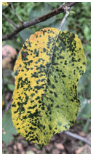
図2 褐斑病 (グリーンアイランド)