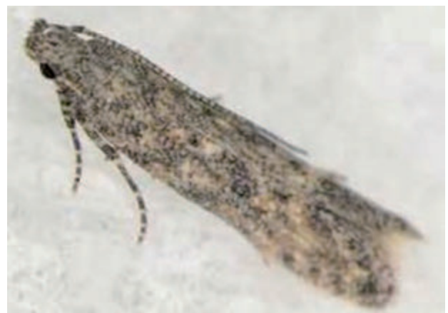
図2 トマトキバガ成虫