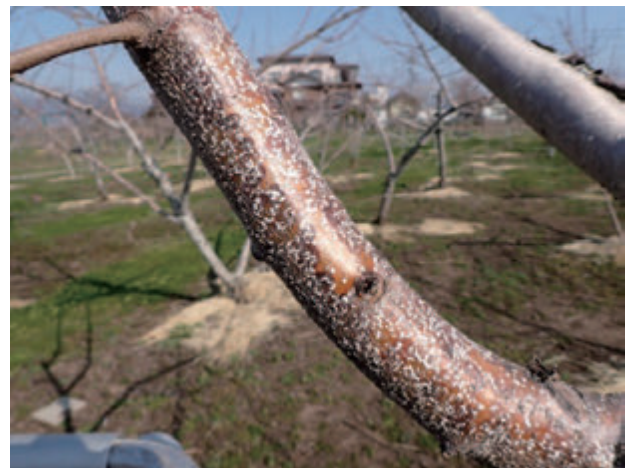
写真2 ももに寄生するウメシロカイガラムシ

本種は成虫で越冬し、平地では年3回発生する。ふ化幼虫の発生時期は、第1世代が5月中～下旬頃、第2世代が7月中～下旬頃、第3世代が8月下旬～9月上旬頃である。