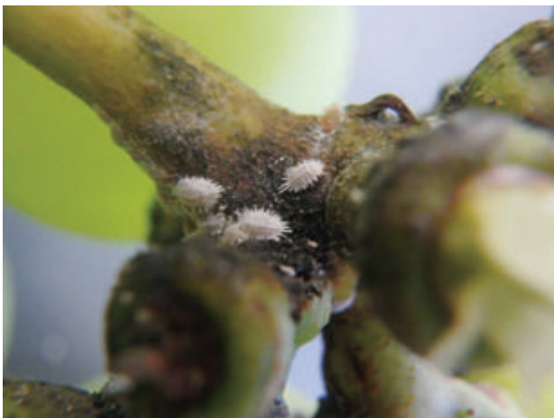
写真1 ぶどうに寄生するクワコナカイガラムシ

越冬は主に粗皮下や大枝切口の隙間等に産み付けられた白綿状の卵のう内の卵塊です。年間発生回