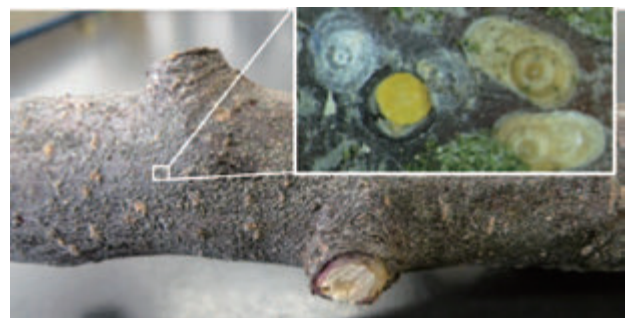
写真3 りんごに寄生するナシマルカイガラムシ

主にりんご、なしの枝幹部に寄生する。寄生された枝の表皮や表皮下は赤紫色に変色する。多発すると枝幹部の表面を覆いつくすようにびっしり寄生し、樹が衰弱、枯死する。果実に寄生すると寄生部周辺がリング状に赤紫色となる。この変色斑は、着色期以降も目立つため実害となる。