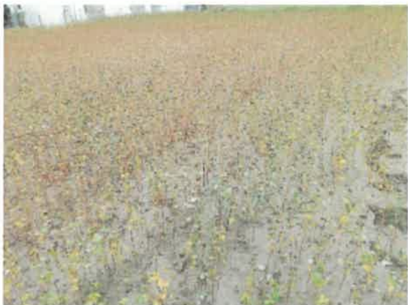
佐久市 土壤湿潤害 10月12日撮影