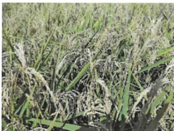
大町市 いもち病害 9月22日撮影

令和3年度の水稲共済は、収入保険への移行が増加し、加入戸数は前年対比91.2%の34,846戸、加