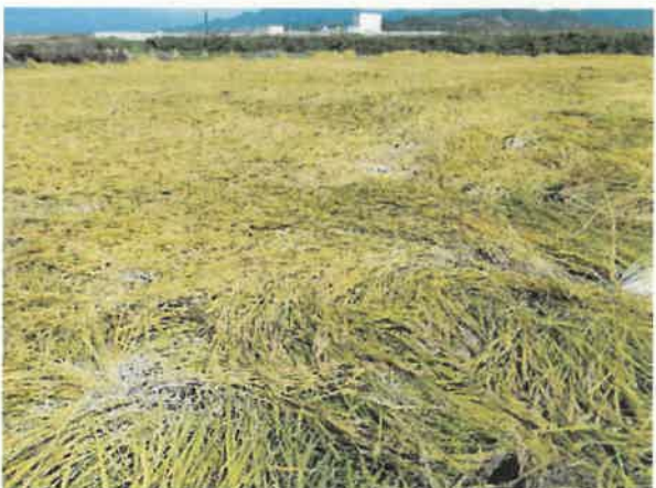
佐久市 風水害 9月30日撮影

入面積は同90.0%の21,121ha。また、収入保険には605戸の3,010haの加入をいただき、合わせて前年対比戸数で92.0%、面積で96.9%となりました。