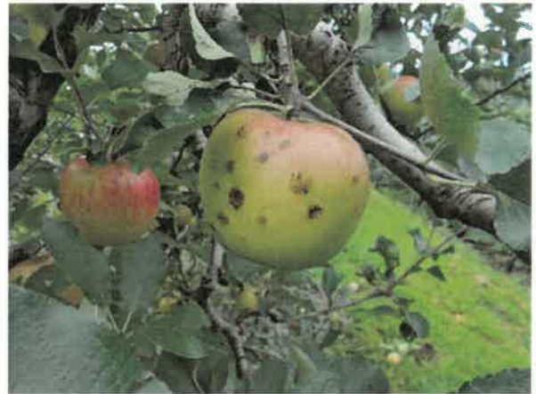
佐久市 ひょう害 8月24日