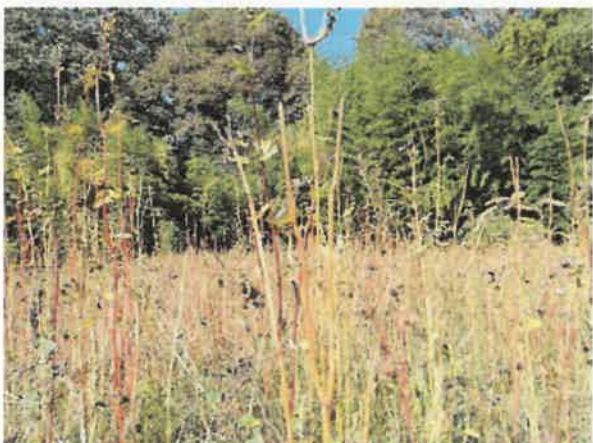
大町市 獣害 10月15日撮影