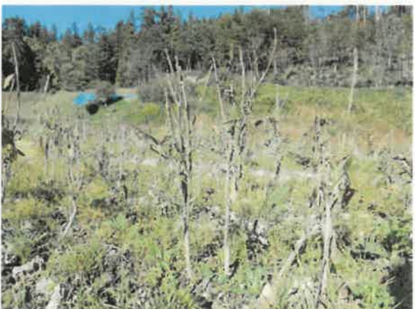
大町市 土壤湿潤害 10月15日撮影