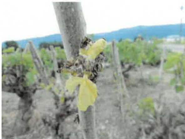
箕輪町 凍霜害 6月3日撮影