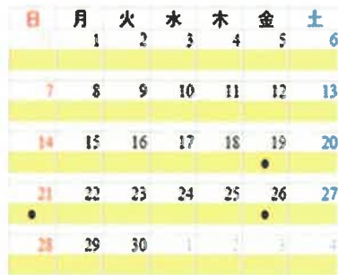
図1 Web画面で表示される感染好適条件の判定結果の例(●は感染好適条件出現日を示す)

ただし、本システムは本病の感染量(発生量)を予測するものではなく、気象条件以外の発生に影響する諸要因(品種、生育ステージ、施肥条件等)については考慮していないため、防除の要否は諸要因も含めて総合的に判断する必要がある。