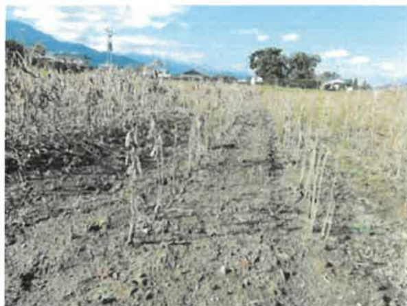
池田町 獣害 10月15日撮影