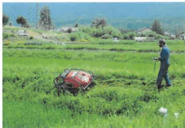
ラジコン式畦畔草刈機による草刈り作業の様子