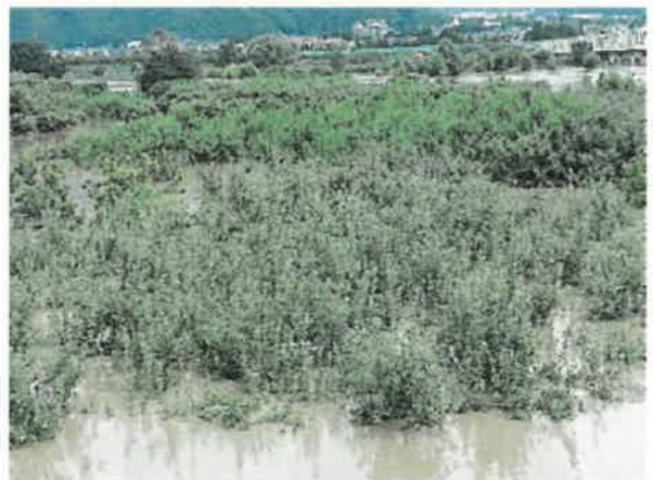
小布施町 水害 8月15日