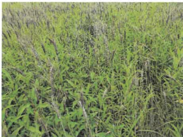
上田市 土壤湿潤害 6月25日撮影