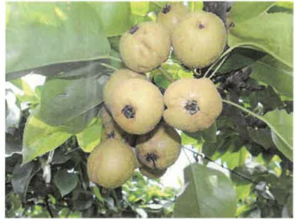
箕輪町 凍霜害 6月28日

ひょうによる被害が発生。さらに、8月13日から8月15日にかけての豪雨による河川の氾濫により樹園地が冠水する被害が発生しました。