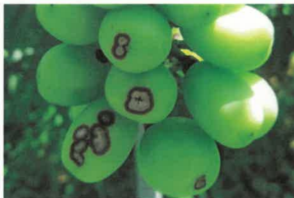
図1 ブドウ黒とう病の果房発病

本年は、発芽前や展葉2～3枚頃の防除を実施していなかった園地や、薬剤散布ムラがあった園地で特に発生が多く認められた。上記の防除を確実に実施し、来年度の安定的な生産につなげていただきたい。