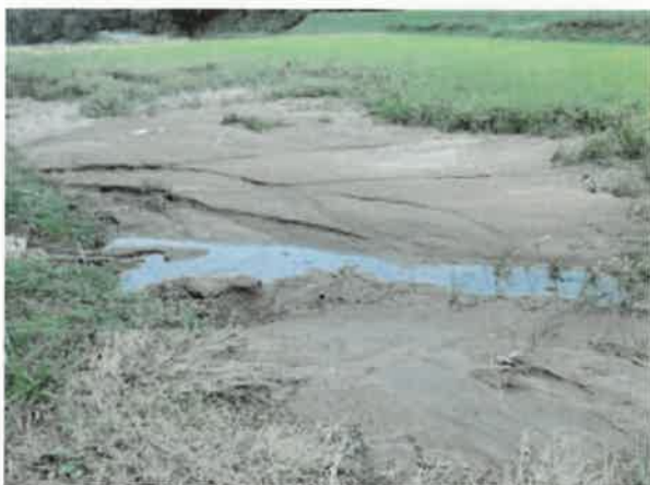
塩尻市 風水害 9月22日撮影