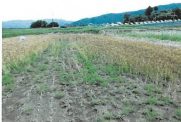
伊那市 雨害湿潤害 6月21日撮影

被害状況は、播種期の降雨による発芽不良・土壌湿潤害、シカ・猿による食害。4月の凍霜害による生育不良等が、中信・北信地域で発生。また、8月の大雨による冠水被害が発生しました。