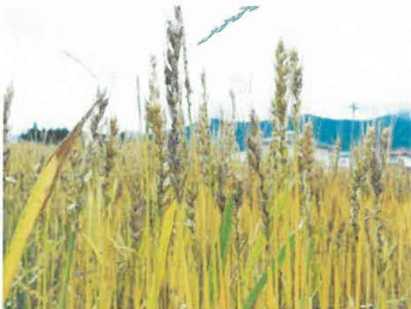
安曇野市 凍霜害 6月18日撮影