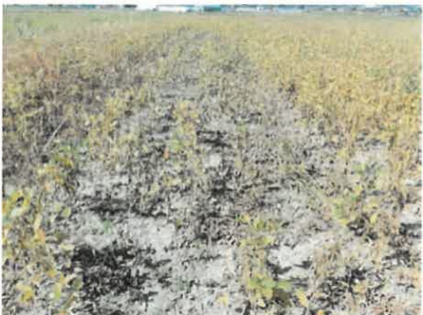
安曇野市 土壤湿潤害 10月15日撮影

被害状況は、播種期～播種後の降雨による土壤湿潤害、8月の大雨によるほ場の冠水や倒伏被害が発生しました。