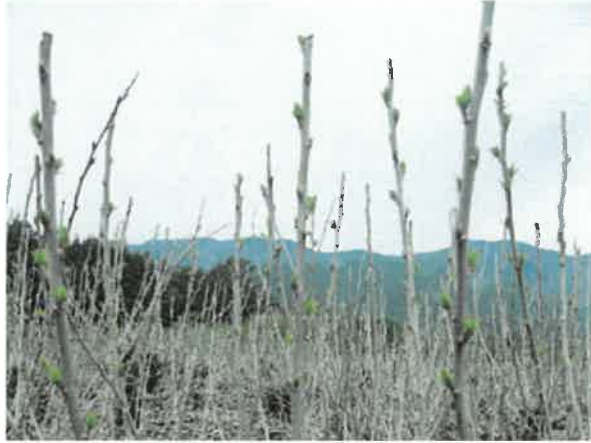
箕輪町 凍霜害 5月16日撮影